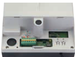
Плата управления E600 - E700HS - E1000, встроенная