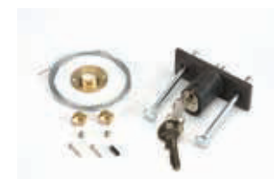
Механизм внешней разблокировки с помощью ключа, для ворот с толщиной полотна более 15 мм, с №1 по №36 (**)