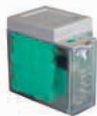
Комплект системы аварийного питания XBAT 24 *