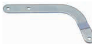
Изогнутый рычаг для секционных ворот