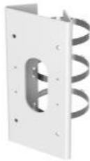
DS-1276ZJ-SUS Крепление на столб