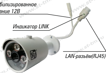
Рис. 1 Схема подключения видеокмеры